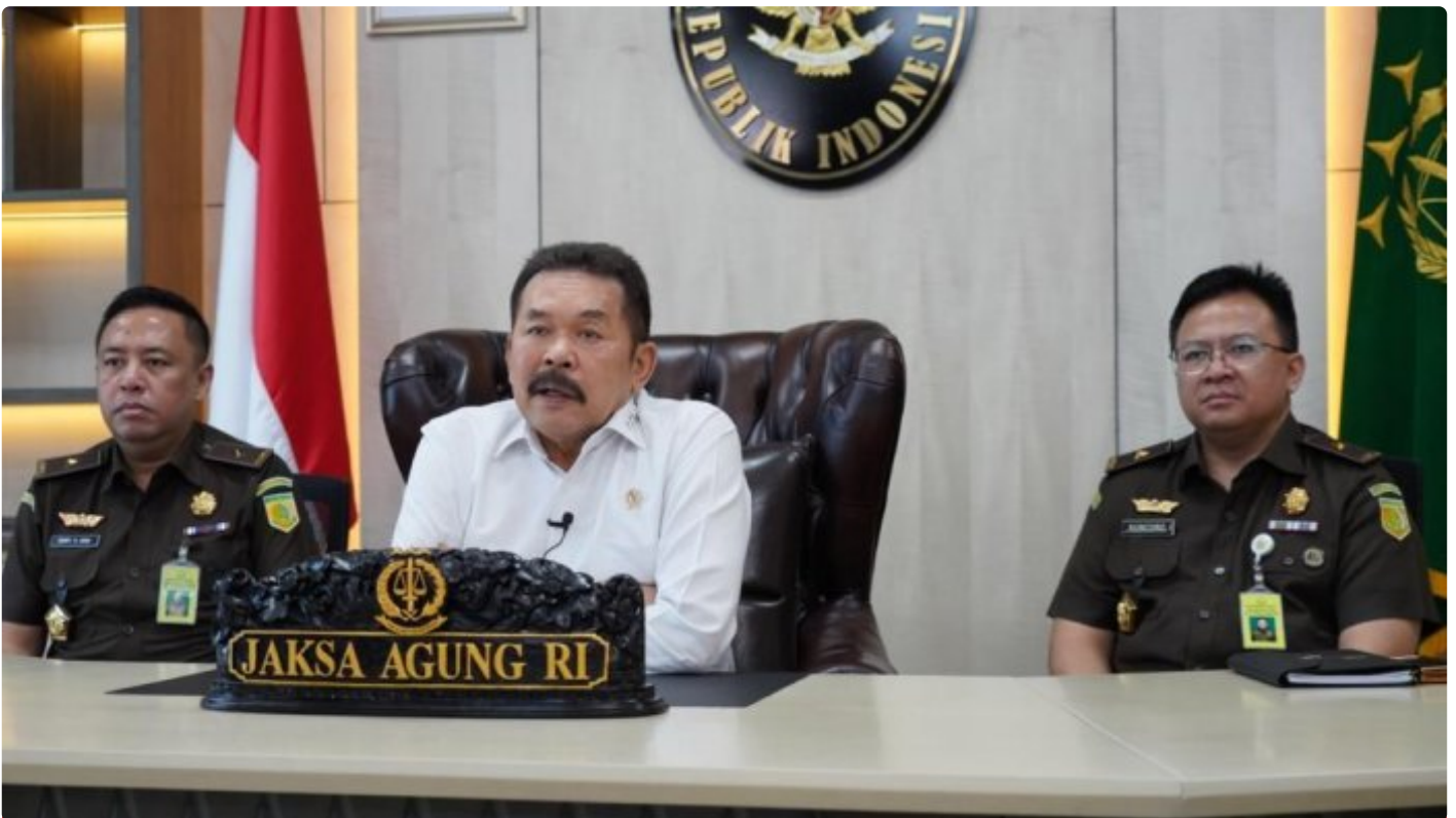
Jaksa Agung, Burhanuddin