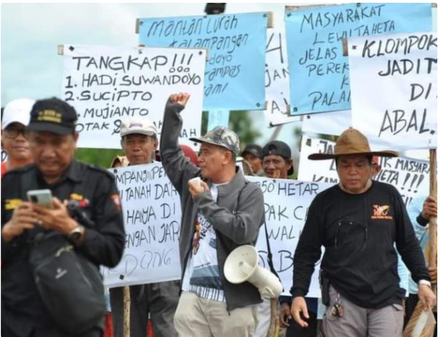
Gambar: Aksi Unjuk Rasa Masyarakat Kelompok Tani

PALANGKA RAYA - Sengketa kepemilikan tanah yang terjadi di Kota Palangka Raya selama ini, cukup meresahkan. Hal ini tentunya bisa mempengaruhi geliat pembangunan di ibukota provinsi Kalimantan Tengah (Kalteng) kedepannya.